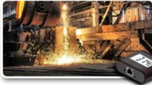
PoE temperature sensor