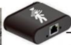
PoE motion sensor