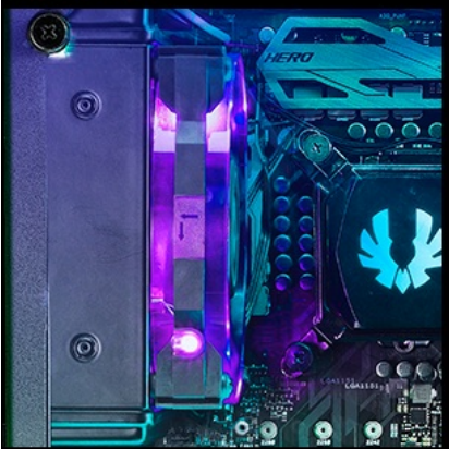
120mm ( radiator )