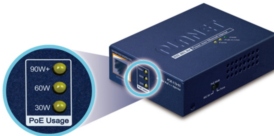
PoE Power Usage Display