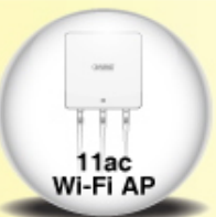
11ac Wi-Fi AP