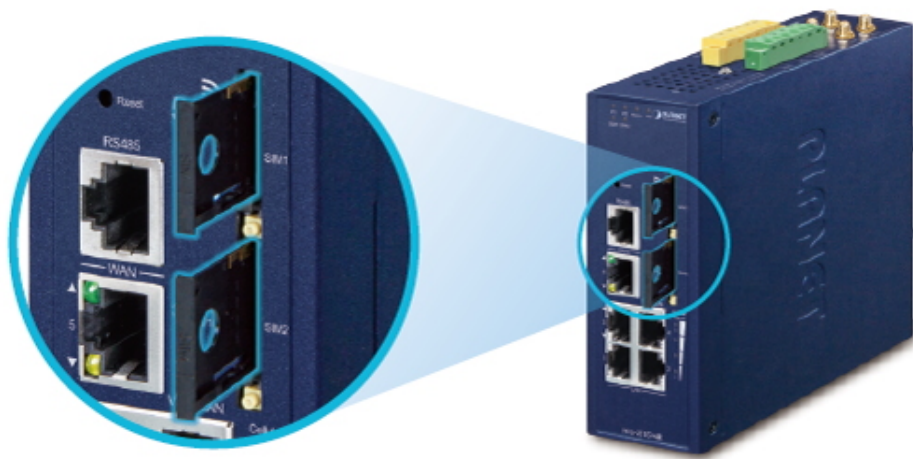
Dual 5G NR